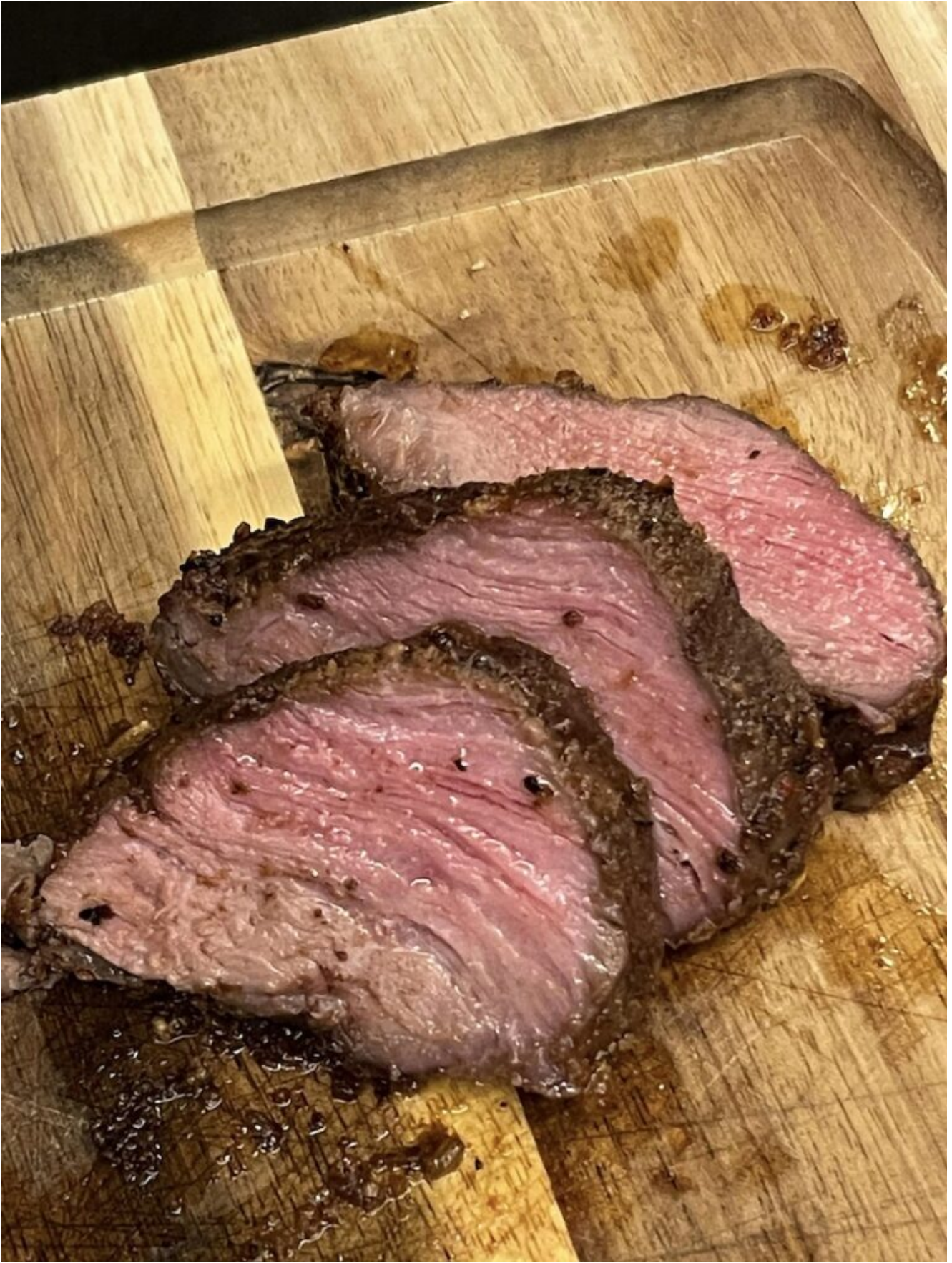
Forkert Udskæring med Fiberne