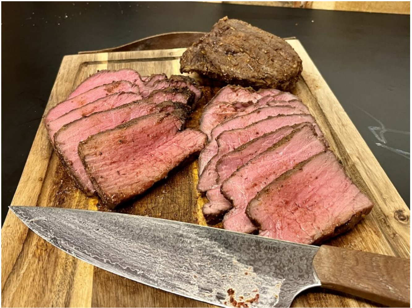
Ball Tip med Champignon sauce og frisk pasta