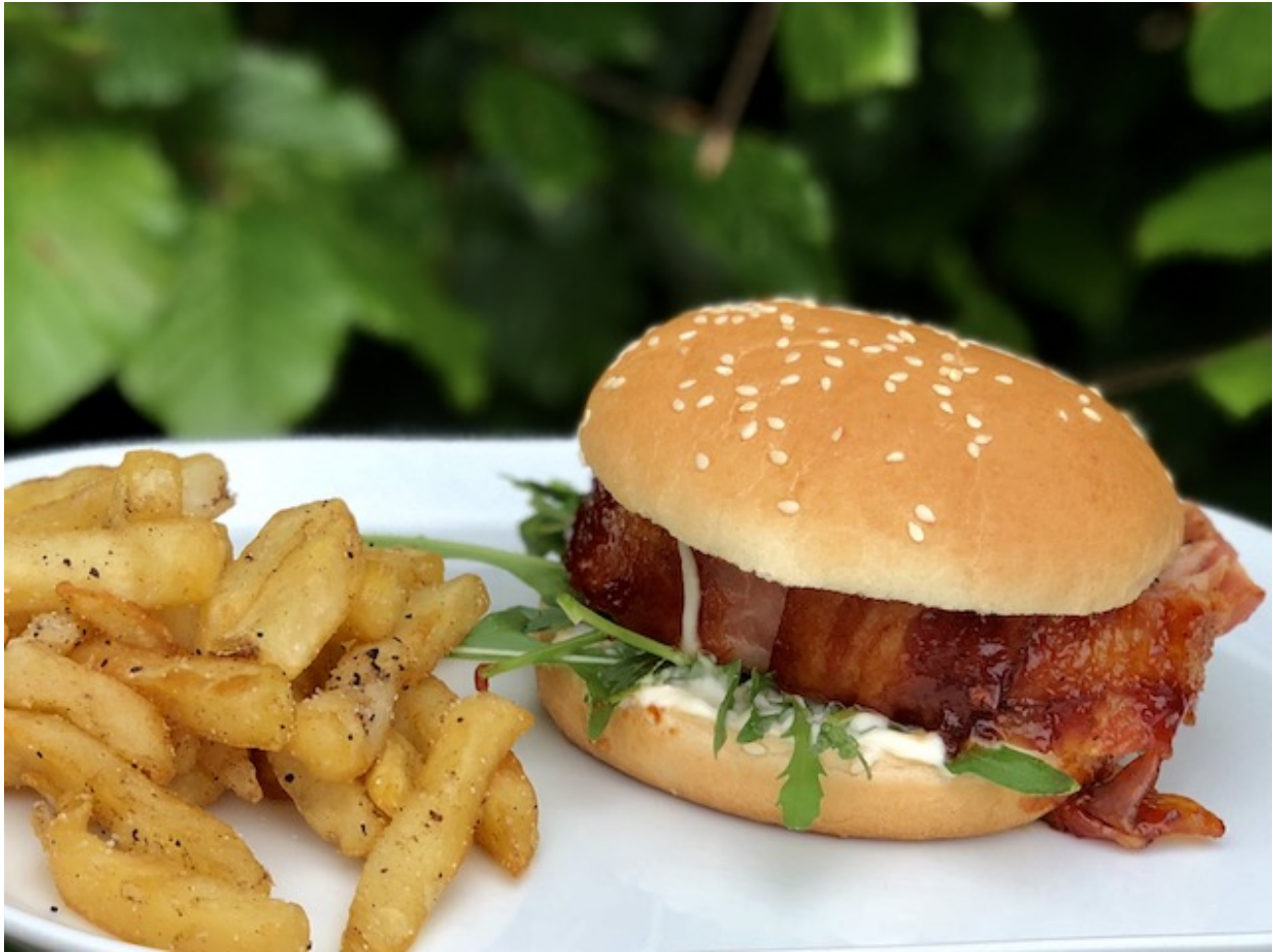
Bacon Bomb Burger

https://boemsen.com/perfekte-mac-and-cheese/