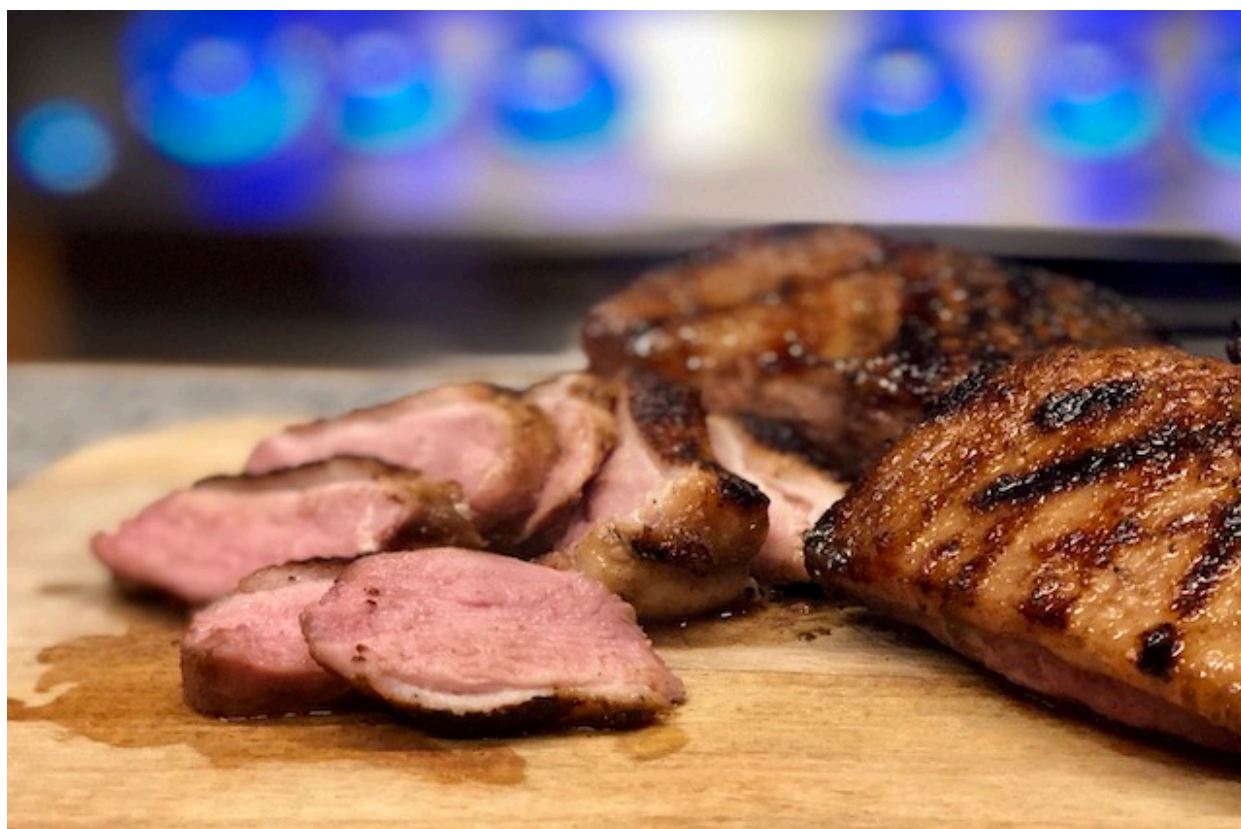
Den perfekte Andebryst på grillen

Andebryst på grillen, for at det skal lykkes, skal du være opmærksom på kvalitet, allerede når du handler. Hvis du har en gårdbutik som sælger ænder i nærheden af ??dig. Så skal du helt sikkert købe din Andebryst der. I den her Andebryst opskrift vil jeg vise dig hvordan du nemt og hurtigt får det perfekte resultat.