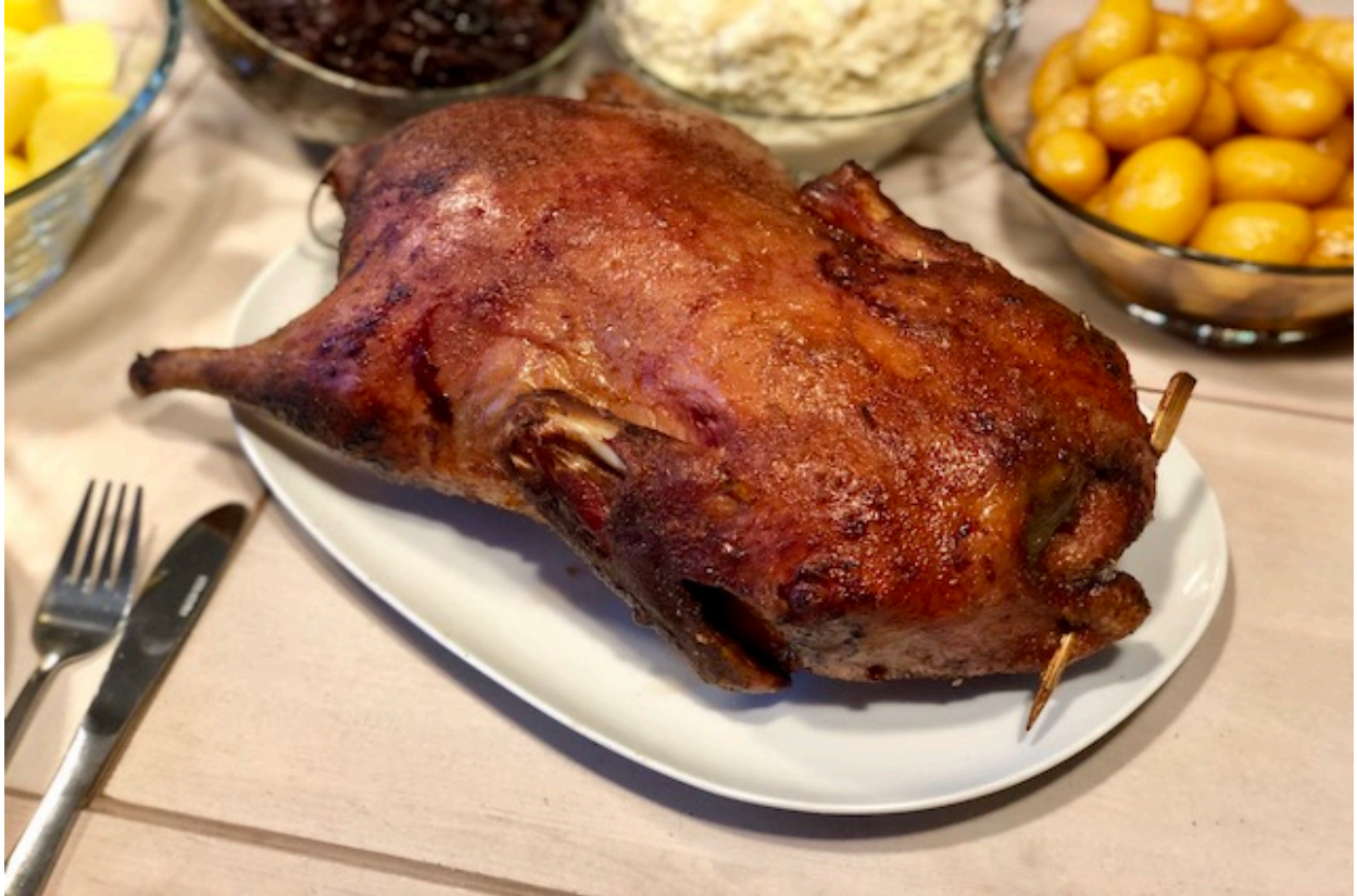
And tilberedt på Traeger træpillegrill

Jeg er ret sikker på at vi også i år får sådan en And Mortensaften og til Jul.