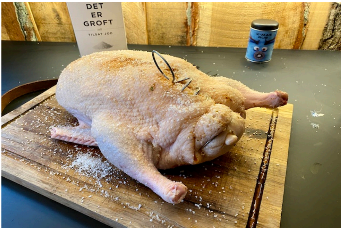
Lukket og saltet And klar til at komme på grillen