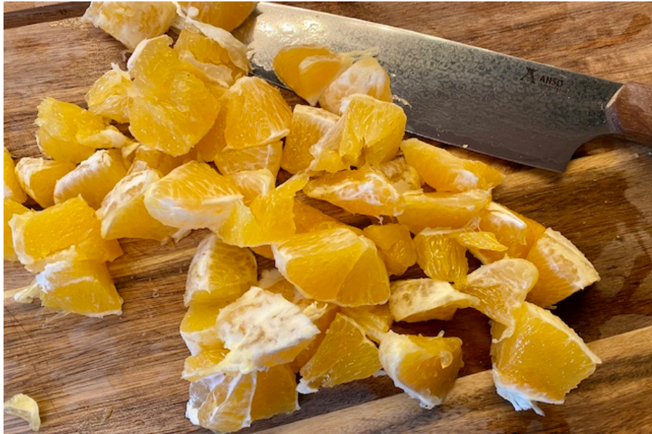
Njord Kokkekniv med ternede appelsin