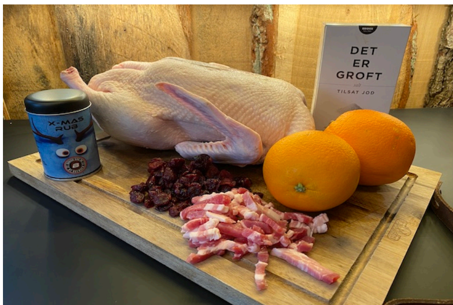
Ingredienser til And à l'orange