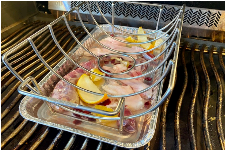
Drypbakke med Napoleon stegholder