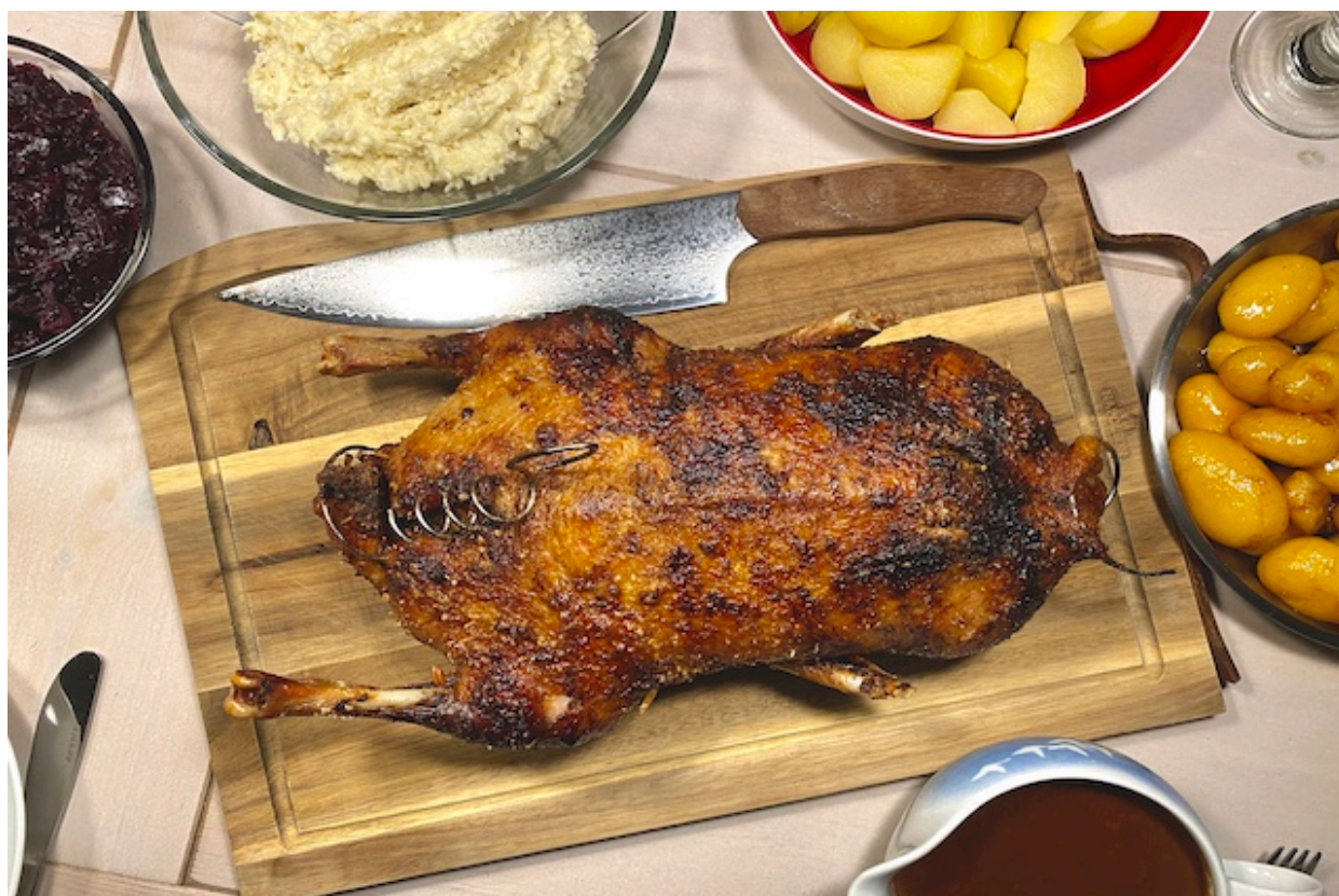
And à l'orange på grill

forberedelsestid ca. 15min. tilberedningstid: ca. 6timer.