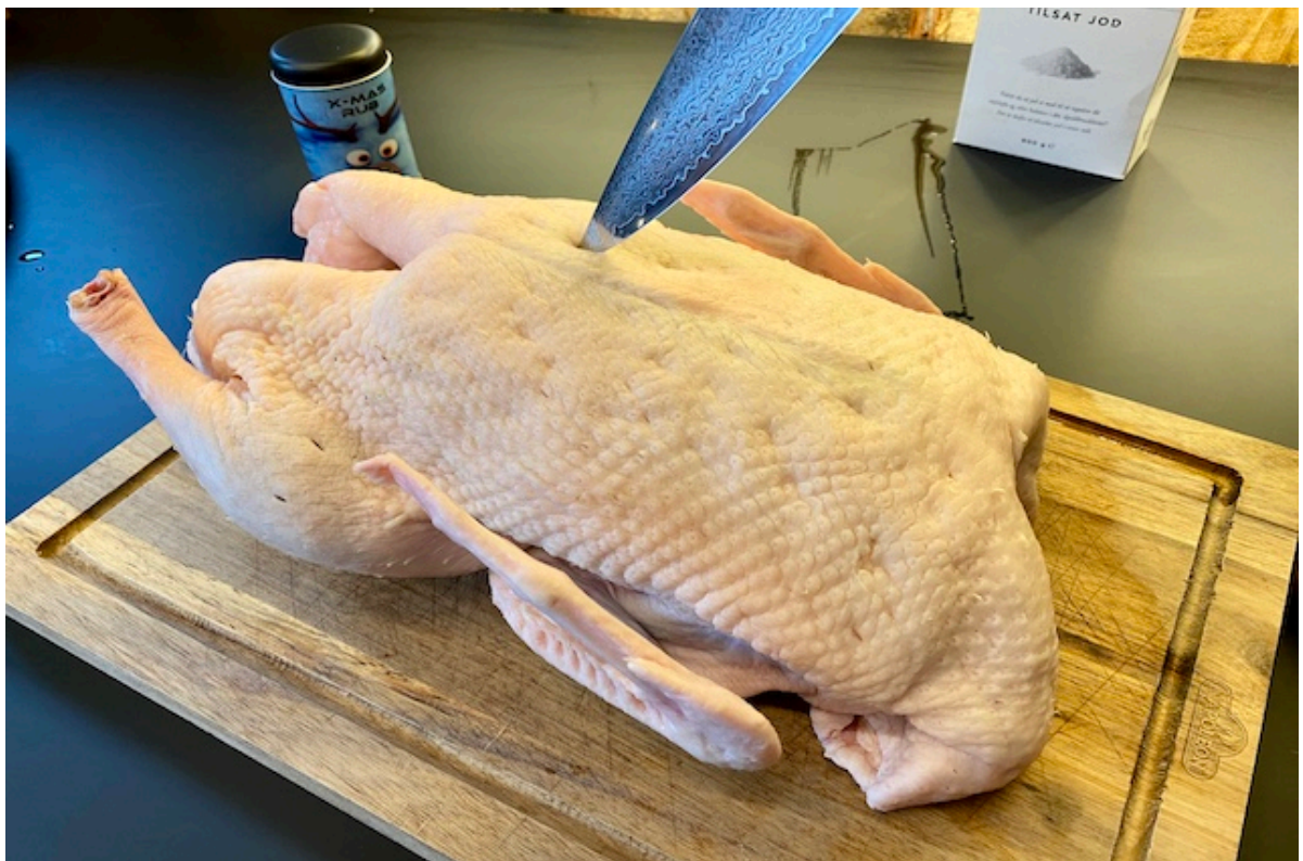
En gennemhullet and