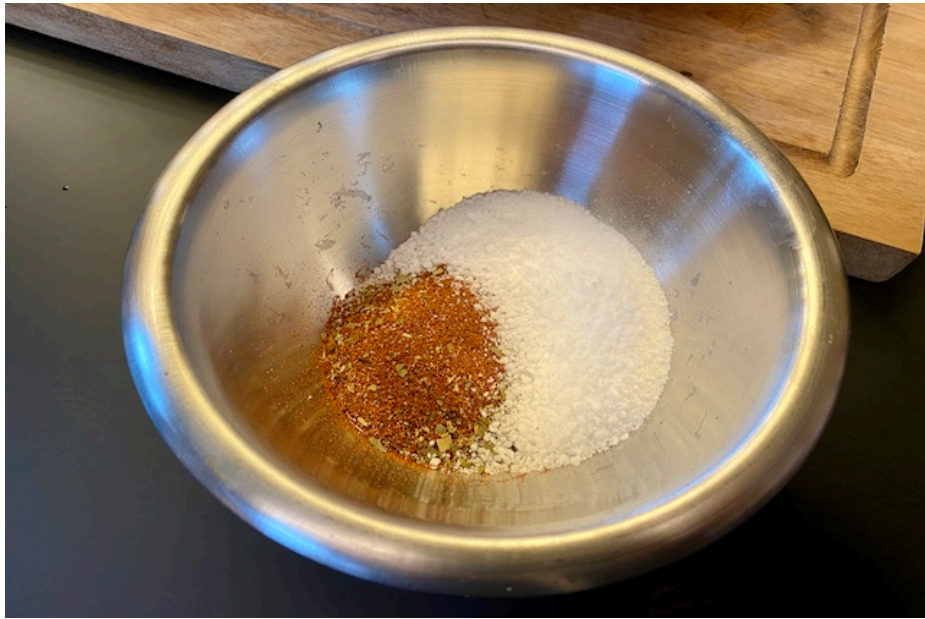
krydderiblanding af 30g X-mas Rub og 150g groft salt