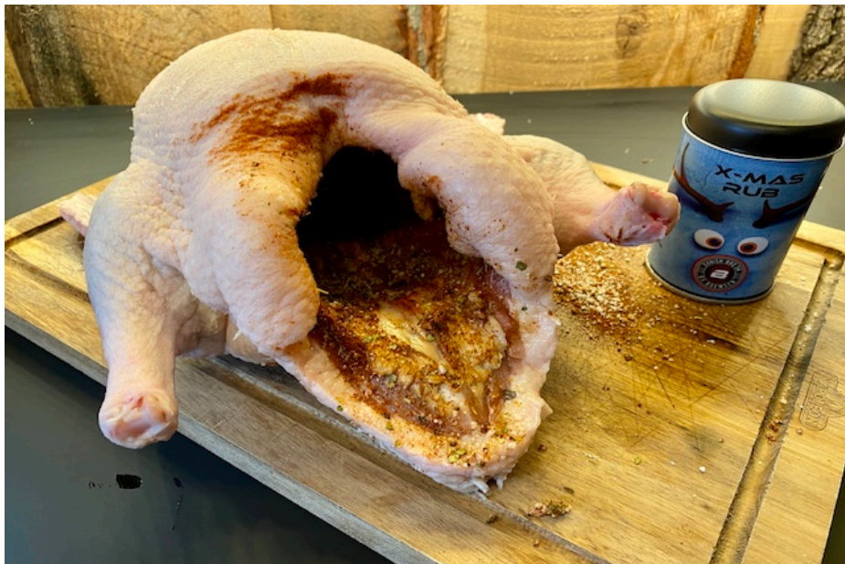
krydderiblanding på indersiden af anden