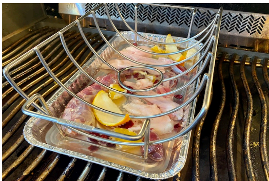
Drypbakke med Napoleon stegholder