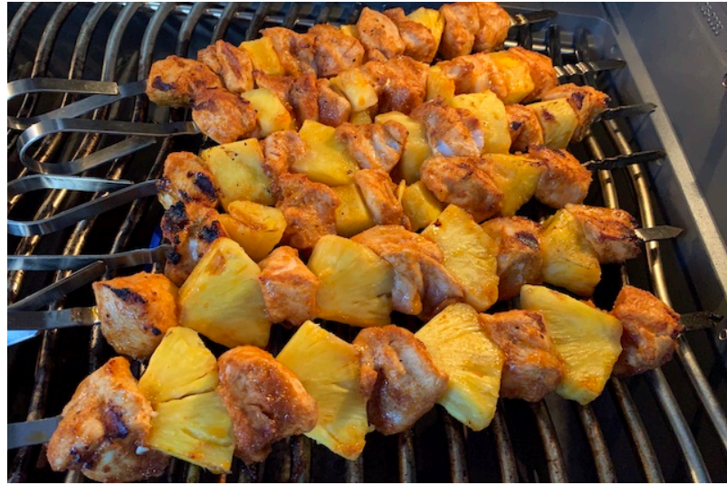
Ananas kyllingespyd på Grillen ved direkte varme