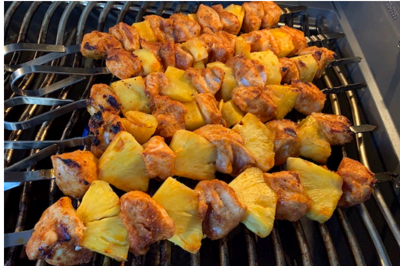
Ananas kyllingespyd på Grillen ved direkte varme