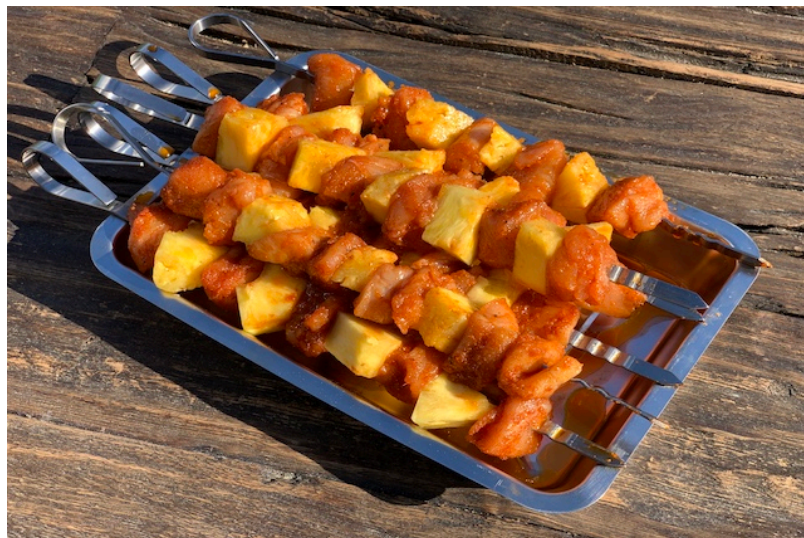
Ananas Kyllingespyd klar til at komme på grillen

Tip: Når man benytter træspyd er det en god ide at udvande dem i 30 minutter. Så holder længer på grillen og forbrænder ikke med det samme.