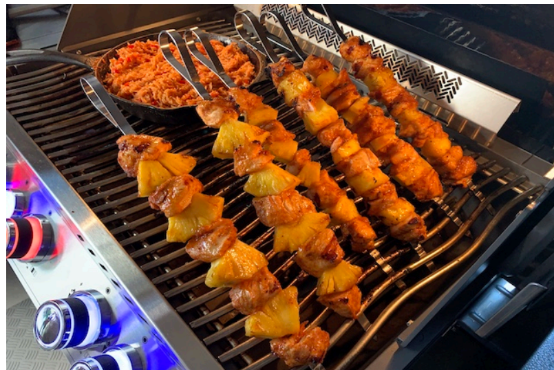
Ananas kyllingespyd på Grillen ved indirekte varme på den nye Napoleon Prestige Pro 500*

Og her de færdig grillede Kyllingespyd direkte fra grillen