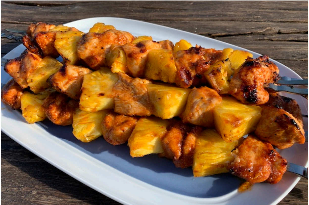
Ananas kyllingespyd færdig grillet og klar til servering