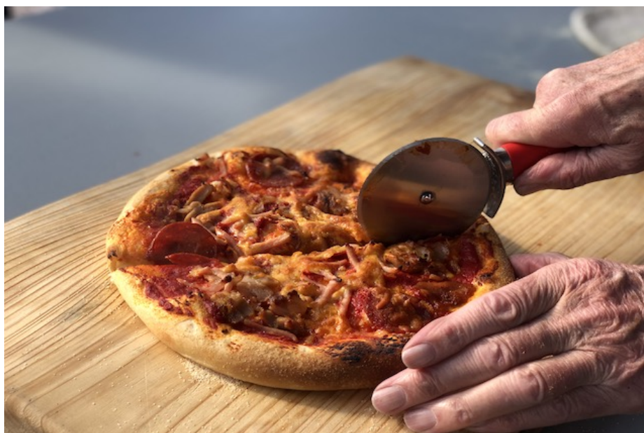
Den færdige pizza som er bagt på en Fredstone Pizzasten