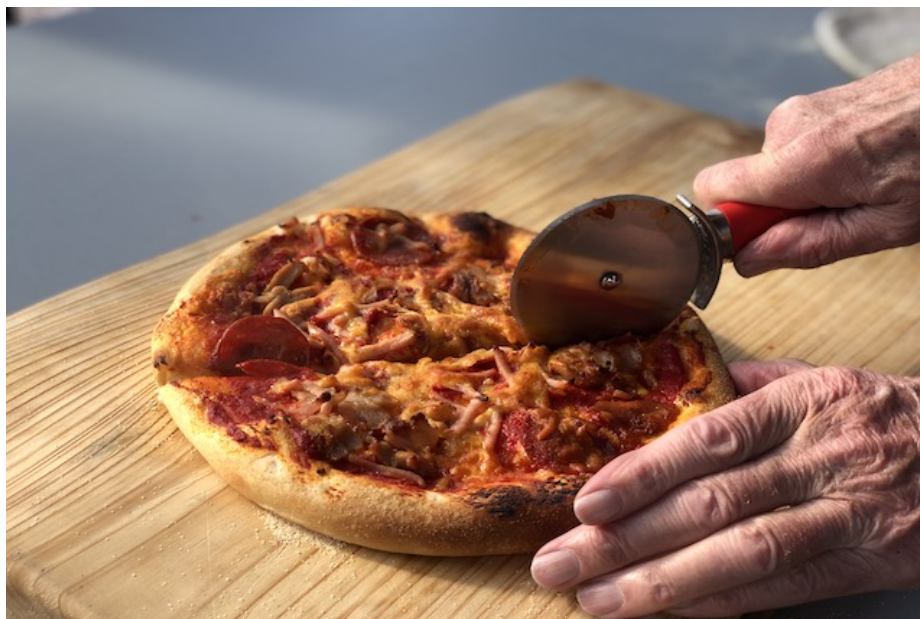
Den færdige pizza som er bagt på en Fredstone Pizzasten